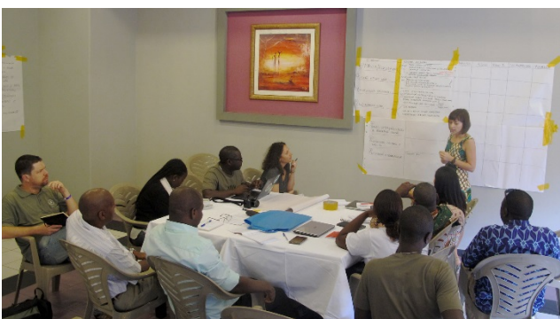
Photos: Atelier en 2016 pour l'élaboration du Plan d'action Protection des sites de reproduction des tortues marines

La MAVA est passée de projets vaguement liés à une vision d'ensemble, mettant l'accent sur la réduction des menaces. Le travail de la MAVA est organisé autour de différents programmes : (1) la Méditerranée ; (2) la zone côtière d'Afrique de l'Ouest; (3) l'Économie durable ; (4) la Suisse ; et (5) une unité transversale pour assurer l'impact et la durabilité des quatre programmes précédents. Au fil des ans, des thèmes clés ont émergé naturellement dans chacun de ces programmes. Avec nos partenaires, nous avons ensuite distillé ces thèmes et les avons reformulés en 25 objectifs, définissant exactement l'impact de conservation souhaité de cette dernière phase de financements (2016-2022) focalisée sur des objectifs de réduction des menaces. (voir le blog de Julien Sémelin, « La question de notre impact » [ et un aperçu des programmes sur le site de la MAVA ]) Les objectifs de réduction des menaces mettent, par exemple, l'accent sur la réduction de la pêche accessoire des oiseaux marins et des tortues marines en Afrique de l'Ouest et sur la réduction de l'utilisation non durable d'eau dans l'agriculture à l'échelon des bassins de la Méditerranée.