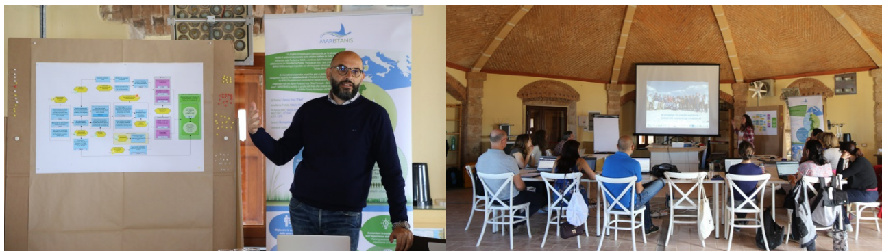
Photos: 2018 le comité de pilotage des lagunes côtières d'Oristano pour l'amélioration de la conservation des zones humides côtières du bassin méditerranéen (OAP M3)

La MAVA et ses partenaires sont accompagnés par FOS Europe - la branche européenne de Foundations of Success (FOS), une organisation spécialisée dans la gestion adaptative de la conservation. FOS Europe apporte des expériences précieuses de processus similaires ailleurs dans le monde et inspire les autres en partageant les expériences de la MAVA. Ils nous aident à renforcer les capacités et à ajuster nos outils et nos processus afin d'appliquer une gestion adaptative.